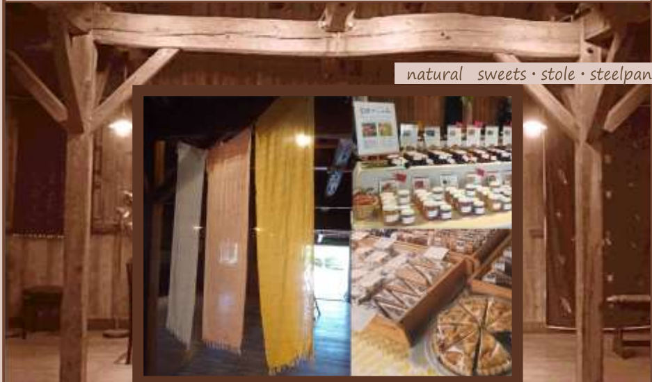
natural sweets · stole · steelpan